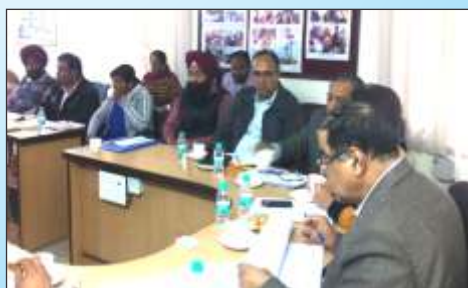
ਧਿਆਨ ਵਿਚ ਰੱਖ ਸਾਰੇ ਇਹ ਗੱਲ, ਧਰਤੀ ਕੋਲ ਹੋ ਸੀਮਿਤ ਜਲ